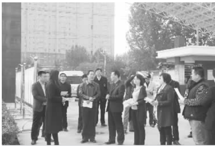
元氏县政协到提案承办单位视察提案办理情况。

日前,元氏县政协针对城建方面的重点提案,专门召开主席会议听取住建局工作汇报,通过协商找出问题关键所在,有针对性地提出了“加大投入力度,精心打造宜居宜业美丽县城”的综合性提案。随后,组织部分常委、委员就县城建设情况进行调研视察并召开协商座谈会,通过实地察看,分析探讨,有针对性地提