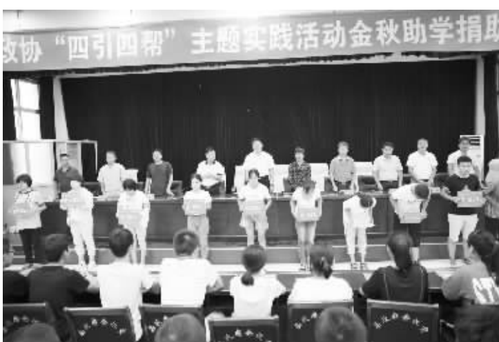
行唐县政协开展金秋助学捐助活动。

为提高社情民意信息的时效性和精准度,行唐县政协建立了“社情民意信息工作微信群”,邀请政府部门和企业负责同志加入,信息员和部门随时就民生问题展开交流;在