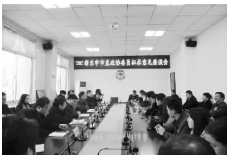
新乐市政协召开政协委员征求意见座谈会。

近年来,新乐市政协把加强和改进民主监督作为推进政协协商民主建设的一项重要内容,重点从民主监督机制、形式、内容入手,不断拓展政协民主监督范围,提高民主监督实效。