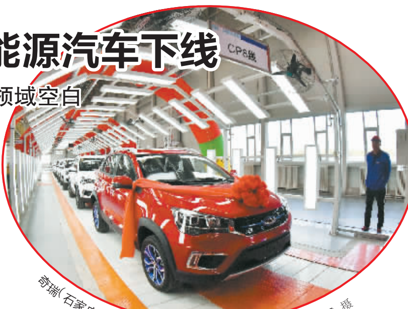
奇瑞(石家庄)新能源汽车首车下线。

新能源汽车代表着我国未来汽车产业的发展方向,也是我市重点发展的“4+4”现代产业的重要板块。(下转第三版)