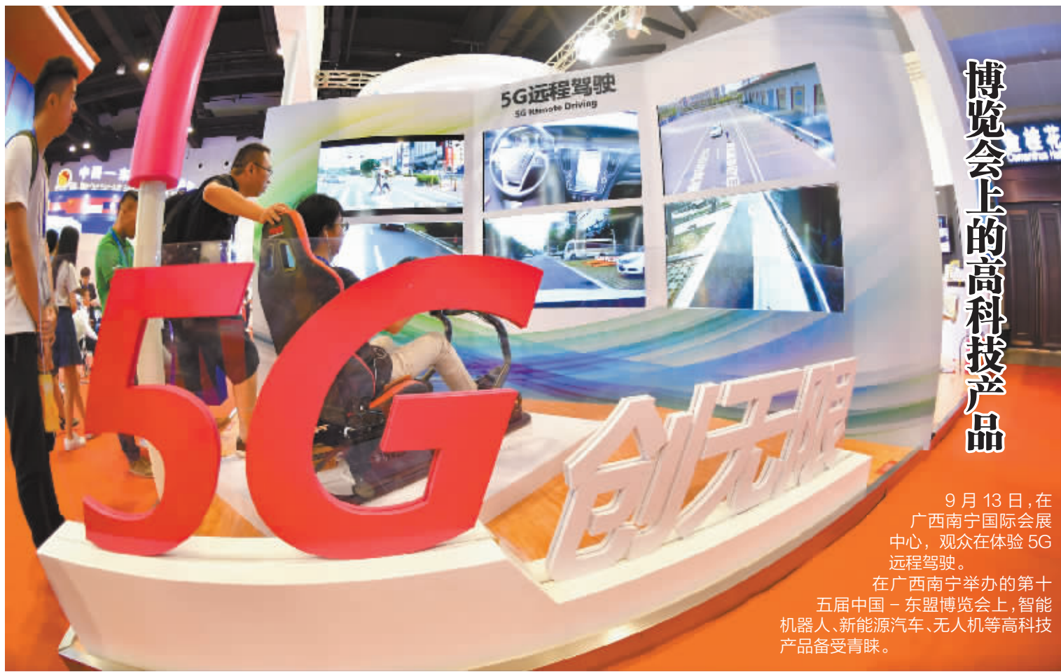
博览会上上的高科技产品

处理办法还明确了司法部和省、自治区、直辖市司法行政机关应当建立报名人员、应试人员失信档案和信用记录披露、查询制度,记录考试违纪人员信息及处理结果,对处以取消本场考试成绩、2年内或者终身禁止参加法律职业资格考试处理的,通过司法行政机关官方网站予以公示,并与其他部门实现信用信息共享。