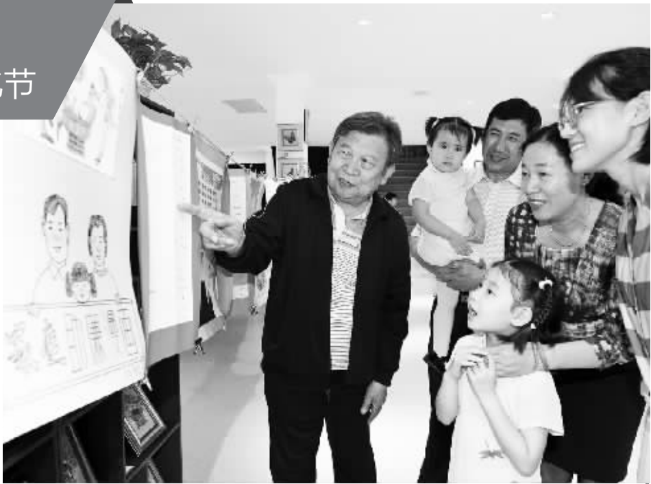
图为在桥西区首届家风文化节上,大家一起参观“家庭助廉漫画”展。

桥西区妇联副主席李艳介绍,在桥西区委、区政府大力支持下,区妇联用心于民,在全区20多万户家庭中中兴起了“家”字文章。