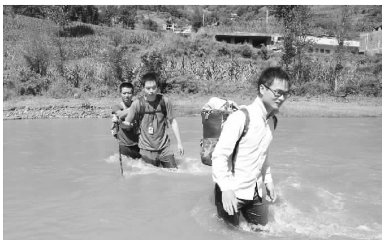
恒大扶贫队员在走村入户的路上

改革开放以来,一大批优秀企业家在市场竞争中迅速成长,一大批具有核心竞争力的企业不断涌现,为积累社会财富、创造就业岗位、促进经济社会发展、增强综合国力作出了重要贡献。恒大自1996年创立,经过20多年的高速发展,已经成为世界500强,年纳税超450亿元。恒大在实现企业跨越式发展的