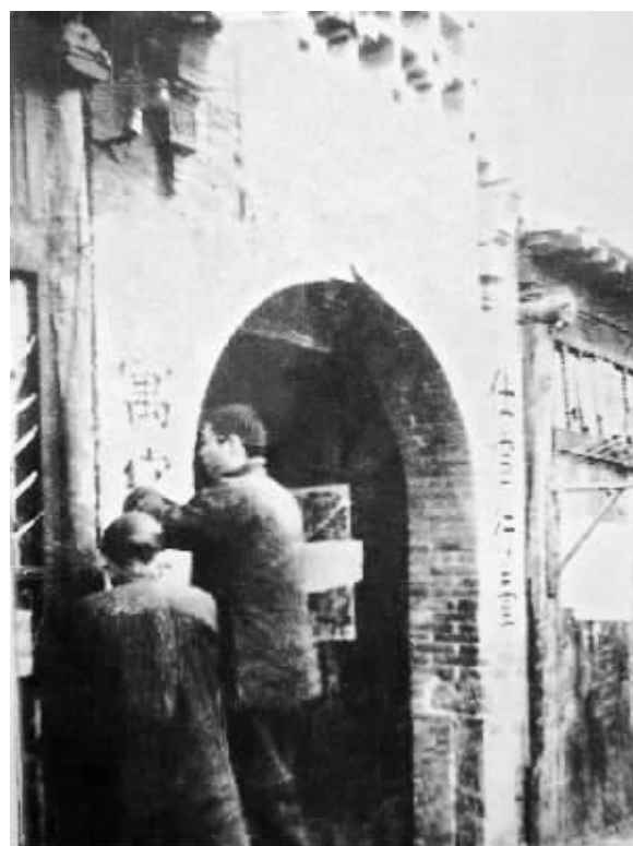
在人民政府的扶植下,各家商场、饭店、旅馆正在积极装修门面,准备开业。