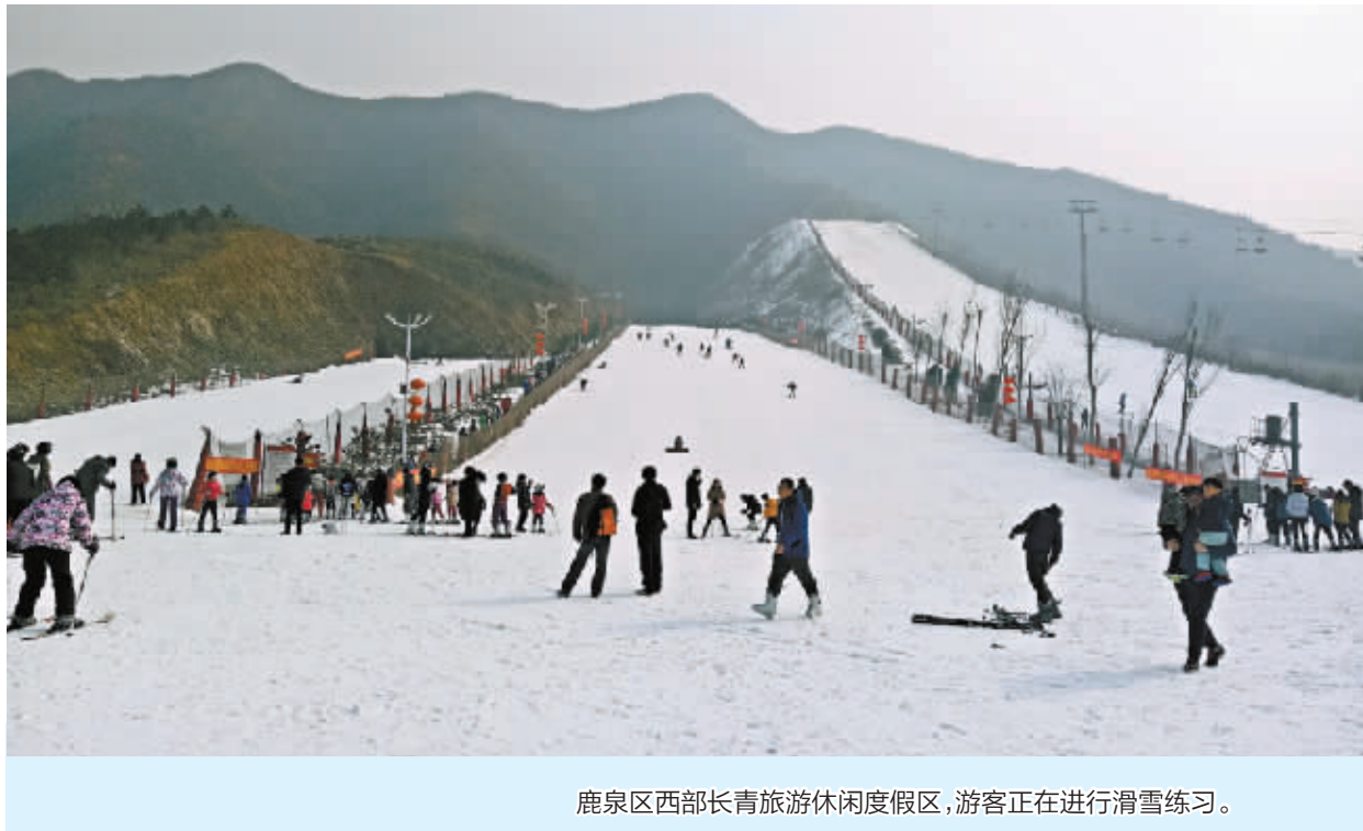
鹿泉区西部长青旅游休闲度假区,游客正在进行滑雪练习。

在资源要素瓶颈制约矛盾日益突出的今天,以最少的资源消耗换来最大的产出,重大项目建设是一条重要的破解途径。近年来,该区坚持一切围着项目干,一切围着项目转,着力扩大在电子信息业领域和休闲旅游服务业、食品加工工业领域的项目投资,挖掘应对新常态的潜能。今年,该区通过实施山前大道改造提升战略支撑,进一步在动能转换上实现新突破,拓展绿色经济新空间,打造总部、食品、创新、物流4个承接京津和省功能转移的基地,全力抓好重点项目建设,为推进鹿泉经济又好又快发展提供强大支撑。