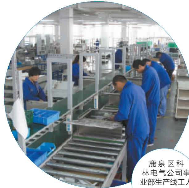
鹿泉区科林电气公司事业部生产线工人们正在有序紧张作业。